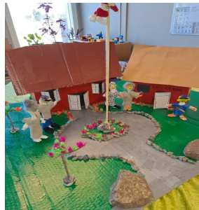
På fritids flödar fantasin när Katthult tar form.

Tack vare att förskolan och skolan till en del har gemensamma lokaler har det lyckats att få till bra undervisningslokaler till alla eleverna. På sikt hoppas man att nya förskolan på Pellgården snabbt kommer på plats.