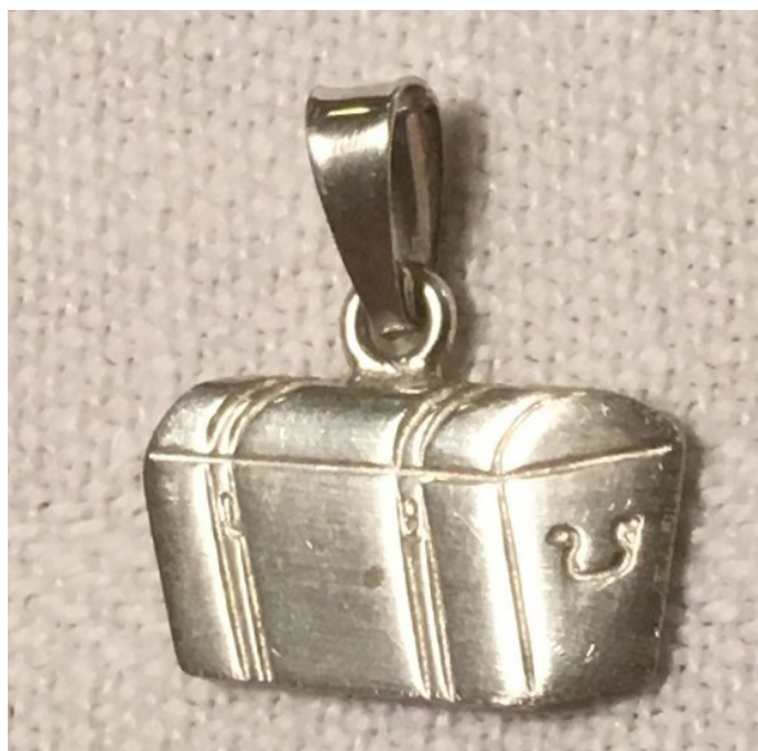
Drängkista i silver, som vann tävlingen om en utvandrar-souvenir 1985.