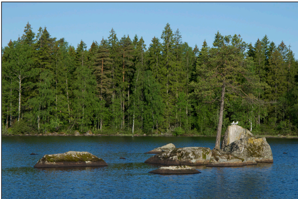
Måsarna vakar över Madsjön.