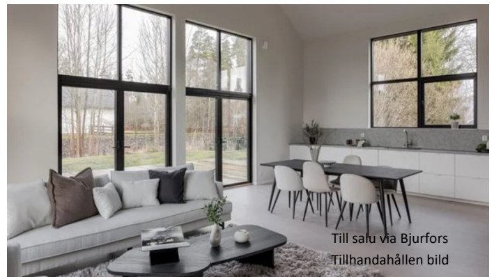
Till salu via Bjurfors Tillhandahållen bild

I samma fastighet på Industrivägen finns Lektum Fastigheter AB . Producenter och bedriver verksamhet inom både nyproduktion av villor och hyresfastigheter samt förvaltning av egna fastigheter i Växjö och Alvesta. Jobbar lite omvänt jämfört med traditionella byggföretag. Man köper en tomt bygger ett hus eller en villa. Hyr ut lägenheter eller säljer en nyckelfärdig villa.