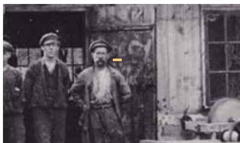
Hallbergs Smedja i Gransholm

Den 25 m långa remdriften i taket som driver de flesta av maskinerna fungerar och flera av maskinerna är körklara. Här finns svarv, slip- och bormaskiner och kallsågen Nils-Gustav. Även också en Åkermansvarv från 20-talet,