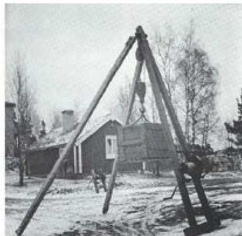
Stenkranen "Herkules" kom att tillverkas i 30 000