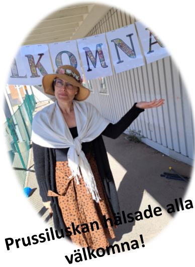
Prussiluskan hälsade alla välkomna!

Mattisborgen och helvetesgapet hade sin givna plats när elevernas fantasi fick flöda fritt.