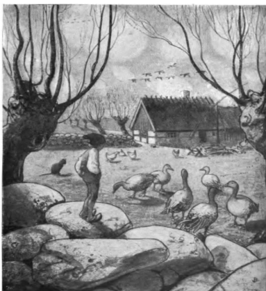
Illustration av John Bauer (Wikipedia)

Torpen låg från början tätt tillsammans alldeles invid vägen i Öja by. Det var nog många bönder som tyckte att så bra läge och goda åkrar borde inte en soldat få ha. Så vid laga skiftet på 1870-80-talen såg man till att de tillskiftades en driftigare bonde och soldaterna blev ålagda att flytta längre bort på utmarkerna - till Sjumanslid bland alla backstugorna där. De tilldelade markerna framgår tydligt av skifteskartorna men varifrån materialet till husen kom är en helt annan fråga.