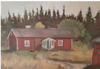
Torpet Vilan, oljemålning av Edit Palm Gård.

Svärmor Vivi föddes i arrendetorpets Furuhult under Bergkvara gård. När möjligheten gavs att flytta till ett bättre torp gick flyttlasset till Vilan. Ett tryggt hem för svärmor trots allt slit för brödfödan.