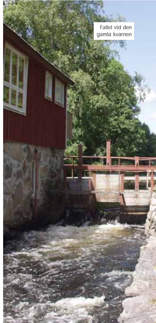
Fallet vid den gamla kvarnen

Självklart finns det olika synpunkter på hur vårt samhälle ska utvecklas. För att alla ska få möjlighet att påverka framtidens Gemla finns Gemla-Öja Sockenråd. Här kan alla ordsbor arbeta tillsammans för att utveckla vår hembygd, driva lokala frågor och se till att alla trivs och känner samhörighet. Ett konkret resultat av detta arbete är att vi, sedan några år, har tillgång till bredband. Ett Sockenrådsprojekt som startades av en handfull entusiaster. Denna snabba väg gör Gemla till en del av världen. En levande landsbygd som är lätt att förälska sig i. För oss som bor här är det enkelt att förstå.