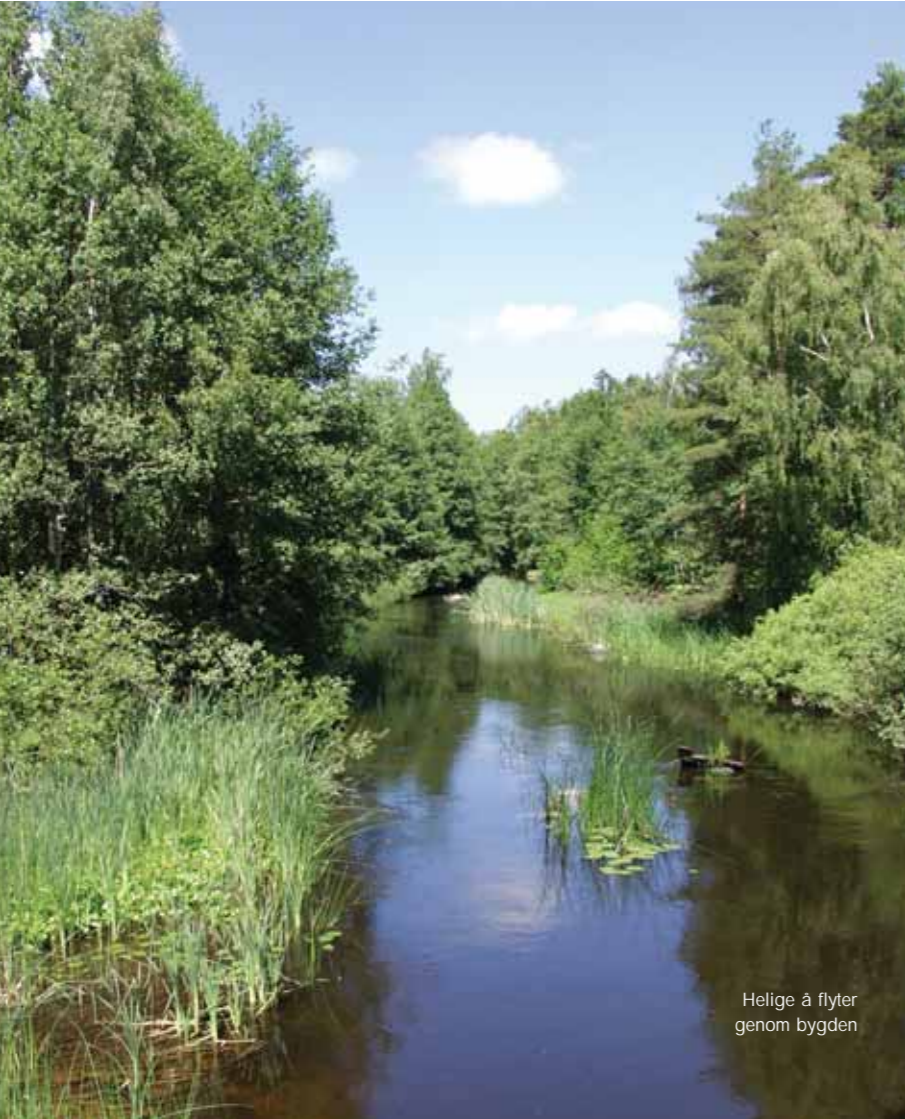
Helige å flyter genom bygden