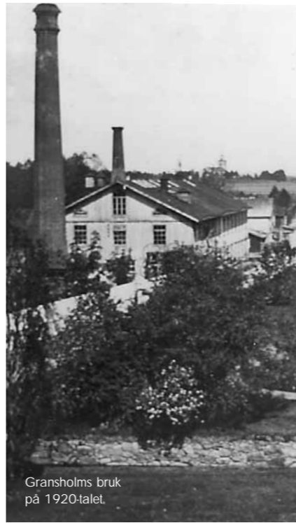
Gransholms bruk på 1920-talet.

Gemla rymmer i sig Sveriges historia. Här finns bönderna, arbetarna och företagen. Kvinnor och män som har skapat jordbruk, industrier, föreningar, hem och trädgårdar. Bondbyarna, de ensamma husen och det moderna stationssamhället har samsats inom den sockengemenskap som ännu består.